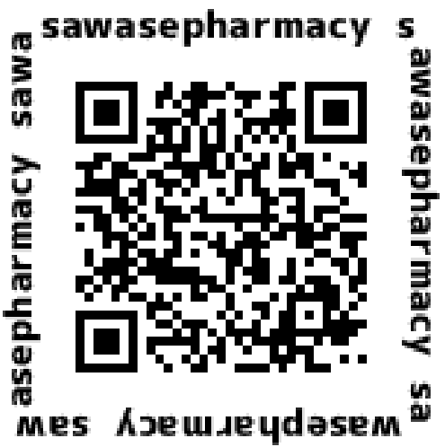
さわせ薬局公式サイト